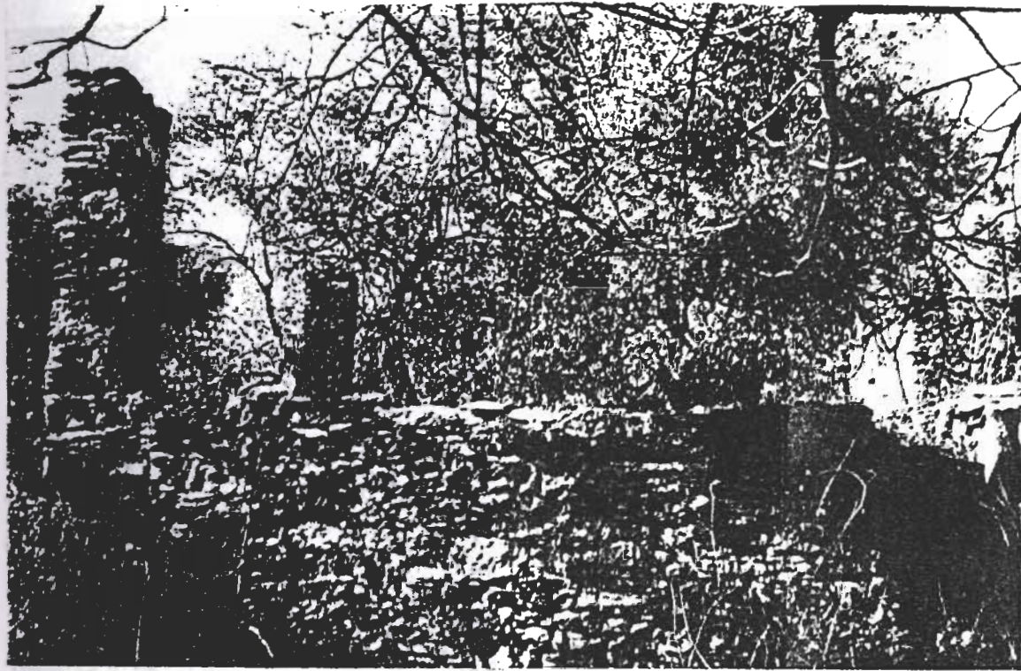
Edificio 1 ; catastrale n° 466