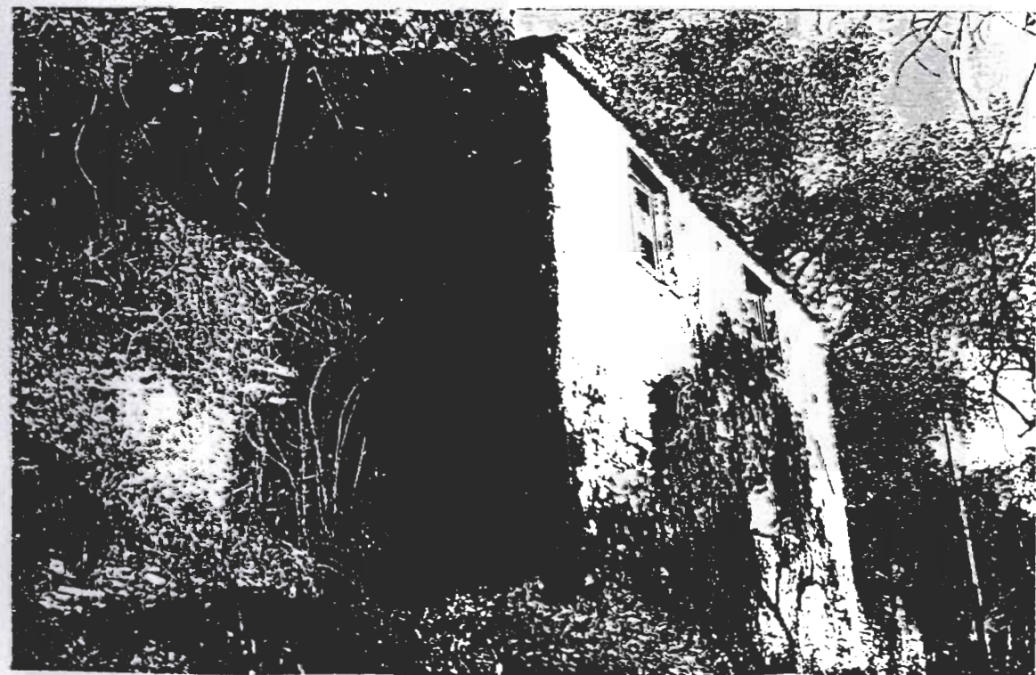
Edificio 10 ; catastrale n° 344