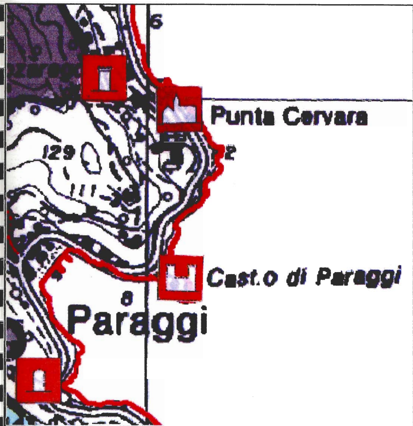
Costa - stralcio scala 1: 5.000